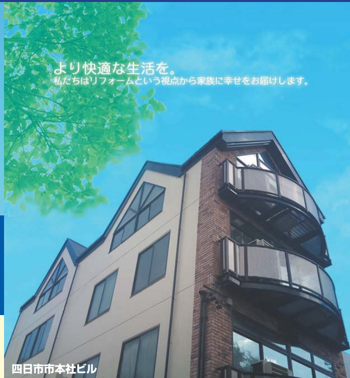
四日市市本社ビル